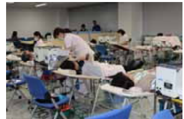
▲ 献血会場の様子（2012年）

冬期、特に2月は、風邪やインフルエンザの流行で全国的に献血者が激減するため年間で最も血液が不足する時期であり、こうしたことから、アフラックでは毎年2月に「特定の人だけではなく、多くの人に“愛”を贈ろう」との思いを込めて、この活動に継続的に取り組んでいます。