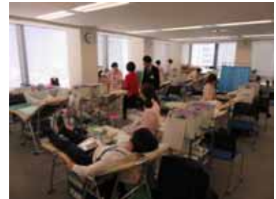
▲ 献血ボランティアの様子（2016年）

冬期、特に2月は、風邪やインフルエンザの流行で全国的に献血者が激減するため年間で最も血液が不足する時期であり、こうしたことから、アフラックでは毎年2月に「特定の人だけではなく、多くの人に『愛』を贈ろう！」との思いを込めて、この活動に継続的に取り組んでいます。