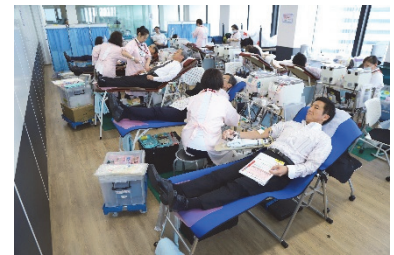
▲献血ボランティアの様子（2019年）

冬期、特に2月は、風邪やインフルエンザの流行で全国的に献血者が激減するため年間で最も血液が不足する時期であり、こうしたことから、アフラックでは毎年2月に「特定の人だけではなく、多くの人に『愛』を贈ろう！」との思いを込めて、この活動に継続的に取り組んでいます。