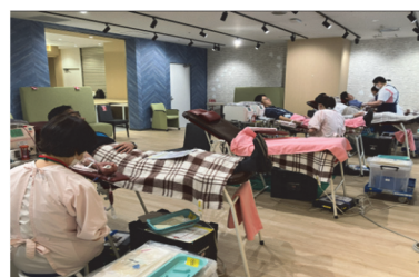
▲献血の様子（2月/調布）

冬期は、風邪やインフルエンザの流行で全国的に献血者が激減するため年間で最も血液が不足する時期であることから、バレンタインのある毎年2月に多くの人に「愛」を贈ろうという趣旨から「バレンタイン献血」と名付け、継続的に取り組んでいます。